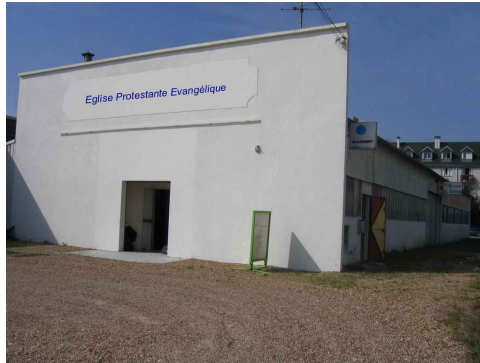
Notre nouvelle Eglise à Tours Nord

3 salles d'école du dimanche dans la nouvelle Eglise. Youpi !